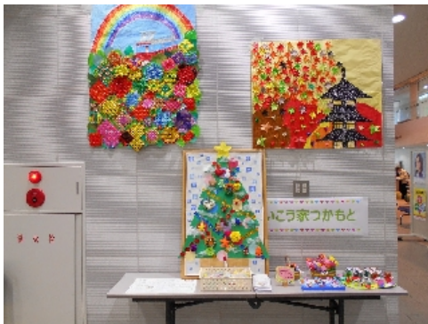
いこう家、つかもと

パサディナ地区にあります「楽しいサロン523」です(写真上左)。毎週水曜日に開催(ただし第5水曜日はお休み)、クラフト製作、紙芝居、茶話会、健康麻雀などが開催されています。令和2年2月と3月の「楽しいサロン523」の行事予定表です(写真上右)。